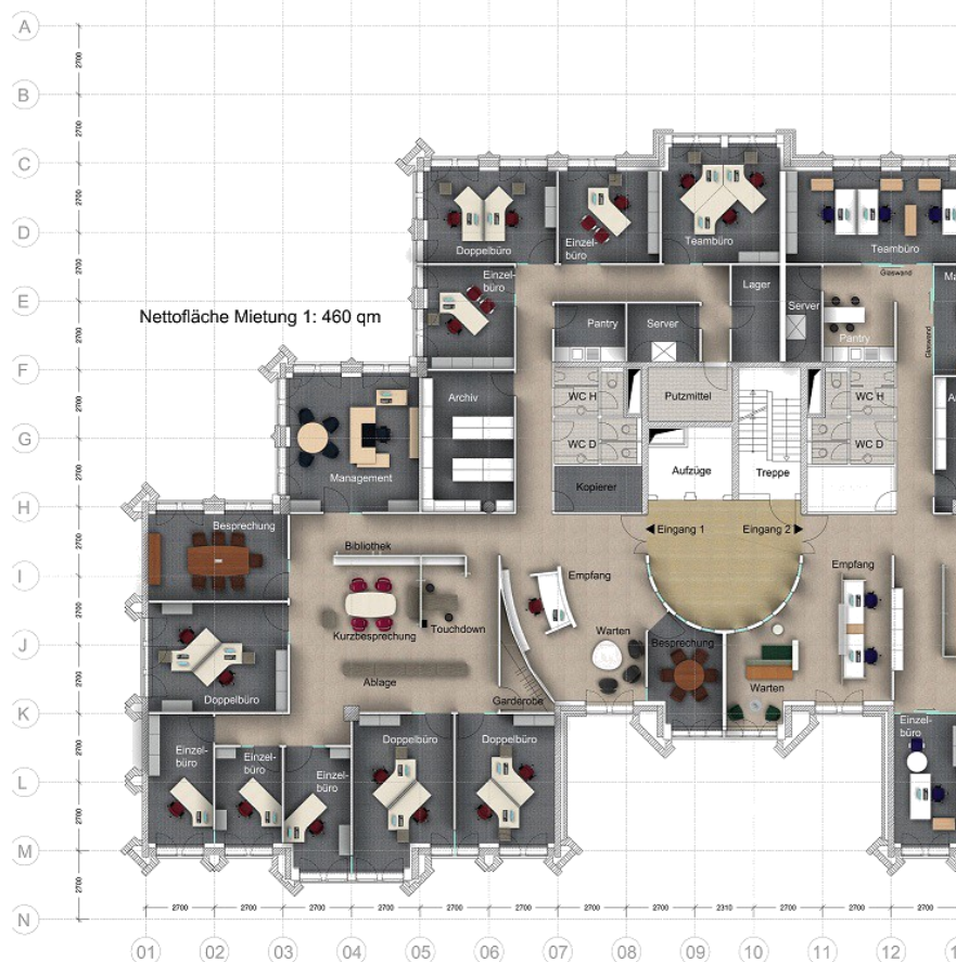
Progetto con più di 60 postazioni di lavoro creato, preventivato e renderizzato in pCon.planner

Il corso avanzato è dedicato alla creazione di materiali di comunicazione coinvolgenti e accattivanti. Gli utenti impareranno come creare texture personalizzate, come utilizzare le diverse tipologie di luci, come padroneggiare la creazione di render di alta qualità, come dare vita ad un progetto attraverso la creazione e condivisione di materiali interattivi e molto altro. La partecipazione a questo corso è riservata ai tutti coloro che hanno completato con successo il corso base.